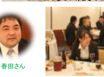
栗島さん萩原君(4月入社予定)に魂注入中