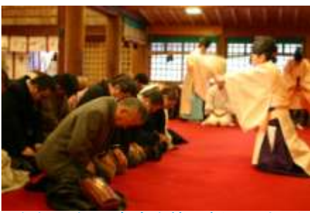
今年一年の安全を皆で祈願しました

新年を迎え、一月四日(水)に毎年恒例の会社の行事である安全祈願が富山縣護國神社にて行われました。今年も交通ルールを守り安全運転を心掛け、無事に無事故で一年が過ぎますようにと祈願しました。