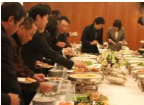
会議の後は新年会!