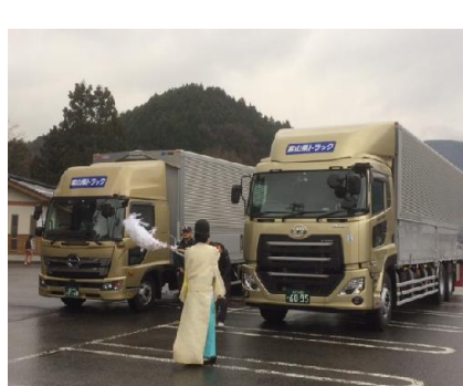
4月7日 13tW(松本運転手) & 4tW(田中運転手)