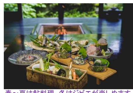
春～夏は鮎料理、冬はジビエが楽しめます