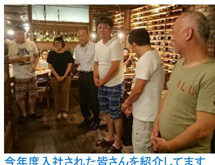
今年度入社された皆さんを紹介してます