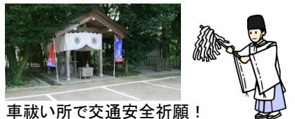
車載い所で交通安全祈願！