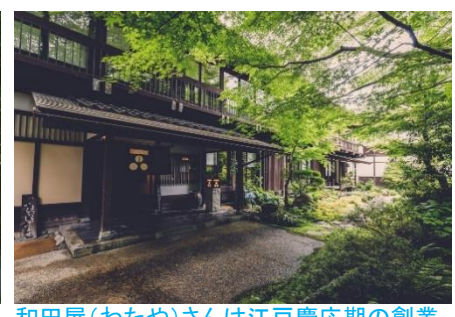
和田屋(わたや)さんは江戸慶応期の創業