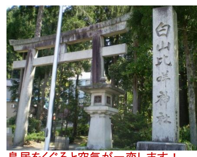
鳥居をくぐると空気が一変します！