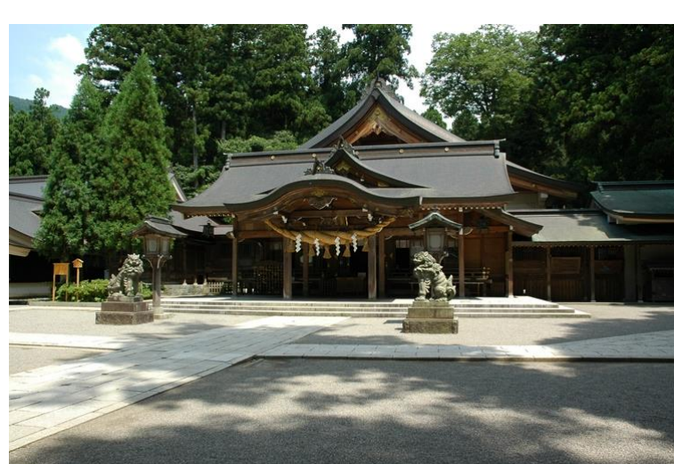
白山比咩神社 しらやまひめじんじやと読みます。凄いパワーを感じます！