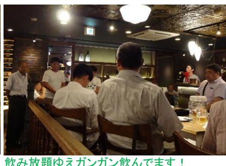
飲み放題ゆえガンガン飲んでます！