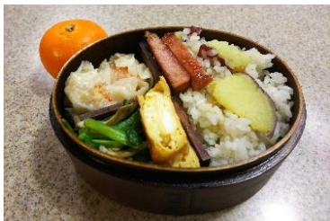
社長のお弁当。皆さんから是非見てみたいとの声で掲載できました。

普段お昼にみんなが、どんなものを食べているか取材し協力頂いたお弁当を掲載します。題して「トラメシ」！取材にあたり、特に社長のお弁当が見てみたいいや、ドライバースさんのお弁当ってあるの？などのリクエストがありましたので、お願いして掲載することができました。今回ご協力いただいた皆様ありがとうございます。(柴山)