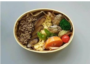
柴山家のお弁当。掲載すると言っていないので後で怒られるかも...