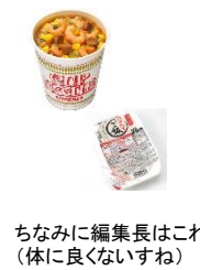
ちなみに編集長はこれ(体に良くないすね)