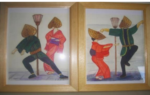
「八尾のおわらの踊り」の様子を描きました