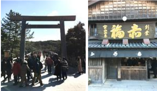
伊勢名物「赤福餅」で有名な赤福本店です その先のおかけ横丁もとっても楽しいですよ!

つい先日伊勢に行ってきました。目的は「伊勢神宮」です。伊勢神宮ってどんなところ?と思われ方もいらっしゃるかと思いますが、簡単に紹介します。「日本人の大御神である天照大神を祀る神社で、約二〇〇〇年の歴史をもち全国の神社の本宗として仰がれている聖地。内宮や外宮をはじめとする一二五社が所属しており、世間では伊勢神宮と言われていますが、正式名称は「神宮」のようです。今や行かなくてもテレビ番組やネットで情報は取れますが、百聞は一見にしかずとは良く言つたもので、やはり訪れて自分の目で見るのは全然違います。すごくイイところ! パワースポットでもあるようで、ビジネスと感じてきました。皆さんも機会があればぜひ訪れてはいかがでしょうか。身も心も清められますよ!