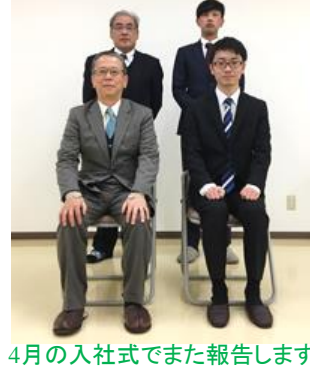
4月の入社式でまた報告します