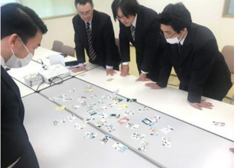
かるたの様子 皆かなり本気モードです(笑)