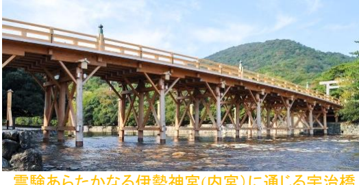
霊験あらたかなる伊勢神宮(内宮)に通じる宇治橋