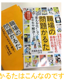
かるたはこんなです